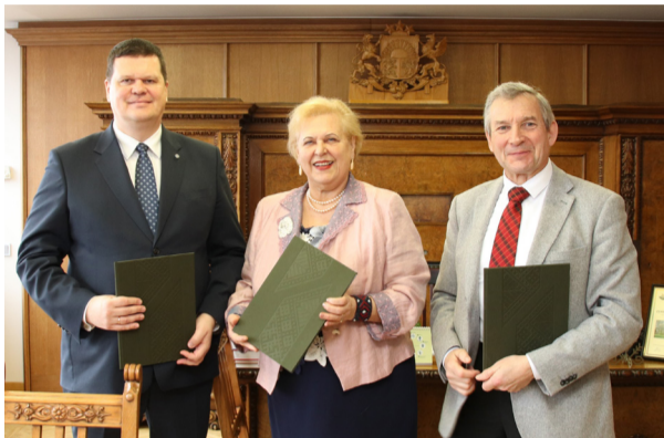
No kreisās: zemkopības ministrs K. Gerhards, LLMZA prezidente B. Rivža, LZA prezidents O. Spāriņis pēc līguma parakstīšanas

Līgums arī paredz dažādus kopīgus pasākumus Latvijas zinātnes sasniegumu popularizēšanā un starptautiskās