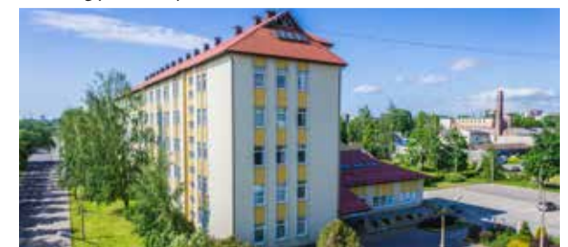
LU Cietvielu fizikas institūta ēka Ķengaraga ielā 8 Rīgā.

2001. gadā sīvā konkurencē LU CFI uzvarēja Eiropas Komisijas rīkotajā konkursā ar projektu "Excellence Centre of Advanced Material Research and Technology" (CAMART). Šī tehnoloģiju pārneses centra misija bija veicināt mūsdienu funkcionālo materiālu un augsto tehnoloģiju izpēti un dalīties ar iegūtajām zināšanām. Īpaša uzmanība tika pievērsta augsto tehnoloģiju lietojumam mikroelektronikā un fotonikā.