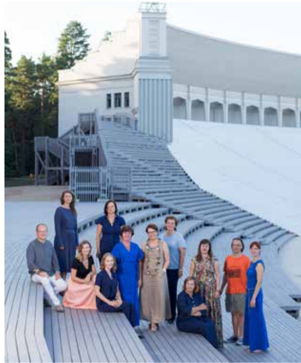
HABITUS pētnieku grupa uz vecās Dziesmu svētku estrādes (arī Mežaparka Lielā estrāde) fona (2018. gads).

Par zinātnes attīstību liecina Latvijas zinātnisko institūciju starptautiskā izvērtējuma rezultāti, kad LKA zinātnieku sniegums tika novērtēts īpaši augstu, esam starp tām 15 no 64 Latvijas zinātnes institūcijām, kas, iegūstot 5 vai 4 balles, tika atzītas par spēcīgu starptautisko spēlētāju.