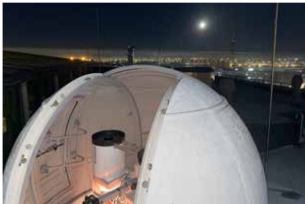
Kosmisko objektu optiskās novērošanas sistēma uz LU Zinātņu mājas jumta naktī.

Nav arī mazāks izaicinājums apvienot pētniecisko darbu ar ģimeni, kurā aug divi puikas.