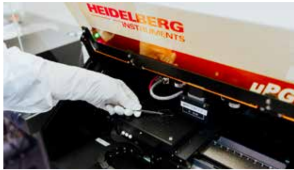
Heidelberg μPG ir tiešs rakstītājs, litogrāfijas sistēma, kurai nav nepieciešamas maskas. Rakstītājā izmanto UV lāzera staru, kuru selektīvi pakļauj virsmām uz parauga.

Šie ir tikai daži no daudzajiem LU CFI zinātniekiem, kas nodarbojas ar augstākā līmeņa zinātnisko publikāciju izstrādi.