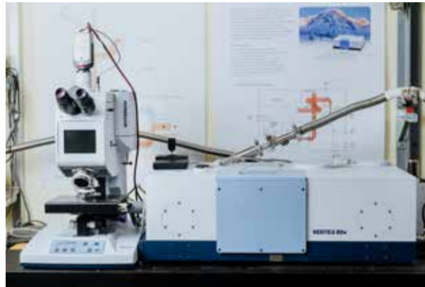
Infrasarkanā starojuma Furjē transformācijas vakuuma spektrometrs Bruker VERTEX 80v dod iespēju veikt FTIR analīzi organiskiem un neorganiskiem materiāliem, kristāliem, pusvadītājiem.

starptautiski konkurētspējīgas pētniecības inovācijas plāno kārtiņu un pārklājumu, elektronikas, šķiedru optikas, sensoru un fotonikas jomās, kas tiek izmantotas sākot no IKT līdz enerģijas ieguves sistēmām.