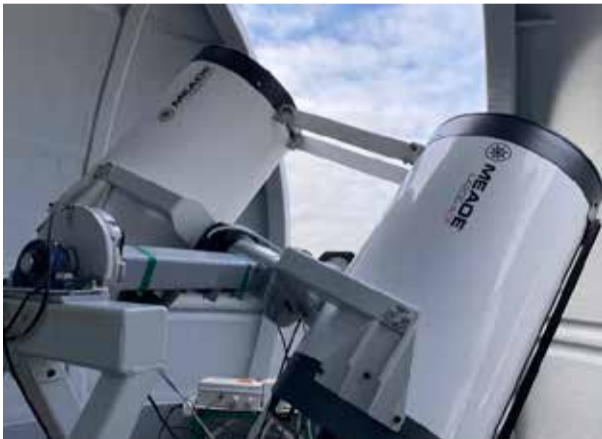
Kosmisko objektu optiskās novērošanas sistēma uz LU Zinātņu mājas jumta.

Pētījuma nosaukums labi atspoguļo galveno projekta mērķi – uzstādīt un konfigurēt institūtā izstrādāto optiskās novērošanas sistēmu un uzsākt tās ekspluatāciju, izmantojot to kosmisko objektu pozicionāliem astrometriskiem novērojumiem. Šis projekts deva iespēju panākt radikālas izmaiņas GGI optiskās sistēmas attīstībā, kā arī nodrošināja pēcdoktorantes jaunu zināšanu un pieredzes apgūšanu. Projekts atbalsta RIS3 (Research and Innovation strategy for smart specialization) mērķu sasniegšanu viedās specializācijas jomā "Viedie materiāli, tehnoloģijas, un inženiersistēmas".